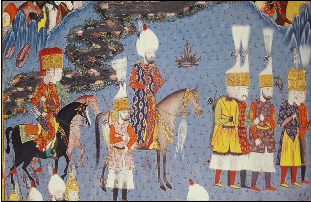
Karaboğdan Seferi'nde Kanuni Sultan Süleyman'ın yanında yer alan Solaklar (Hünernâme, TSMK).