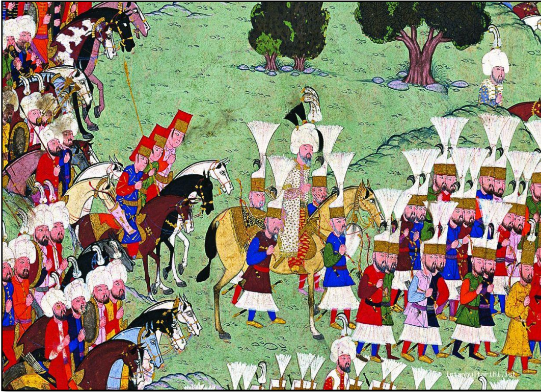
Kanuni Sultan Süleyman ve yanındaki Solak Birliği (Hünername, TSMK).